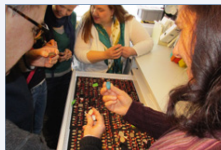
Eine Gruppe von Studierenden nimmt die Skarabäensammlung in Augenschein.

biblischen Text mit anderen Augen. Einige Ausleger sprechen gar von einem Offenbarungscharakter, den die archäologischen Funde besitzen. Eine Kenntnis des ORIENTS, seiner Traditionen und Bräuche hilft immens für ein besseres Verständnis der BIBEL. Denn die Bibel ist ein orientalisches Buch. Diese Grundeinsicht gehört auch zum Bachelor-Studium Theologie – aber auch alle anderen Besuchenden sind eingeladen darüber nachzudenken. fll