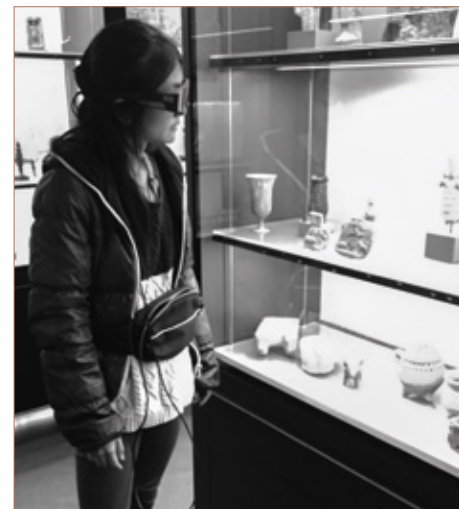
Eine Testperson beim Betrachten der Vitrine: Der so genannte eye-tracker, der die Augenbewegung aufzeichnet, ist das wichtigste Messinstrument beim Versuch.

Wir bedanken uns für die gute Zusammenarbeit und freuen uns auf die Resultate. mms/lp