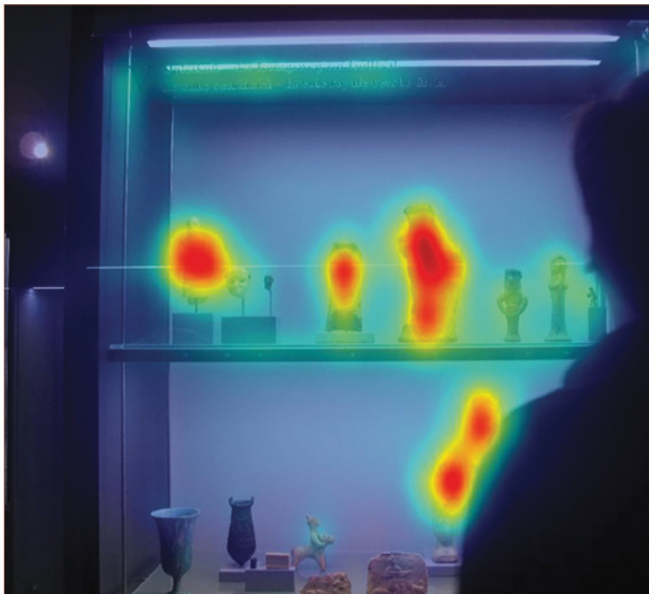
In dieser Darstellung werden die Fokuspunkte der Betrachterinnen und Betrachter farblich dargestellt. Die rote Einfärbung lässt die optischen Highlights erkennen. Welche sind es wohl in Vitrine V? Prüfen Sie es doch einmal selbst nach!